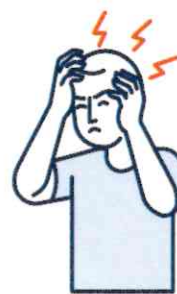
Maux de tête