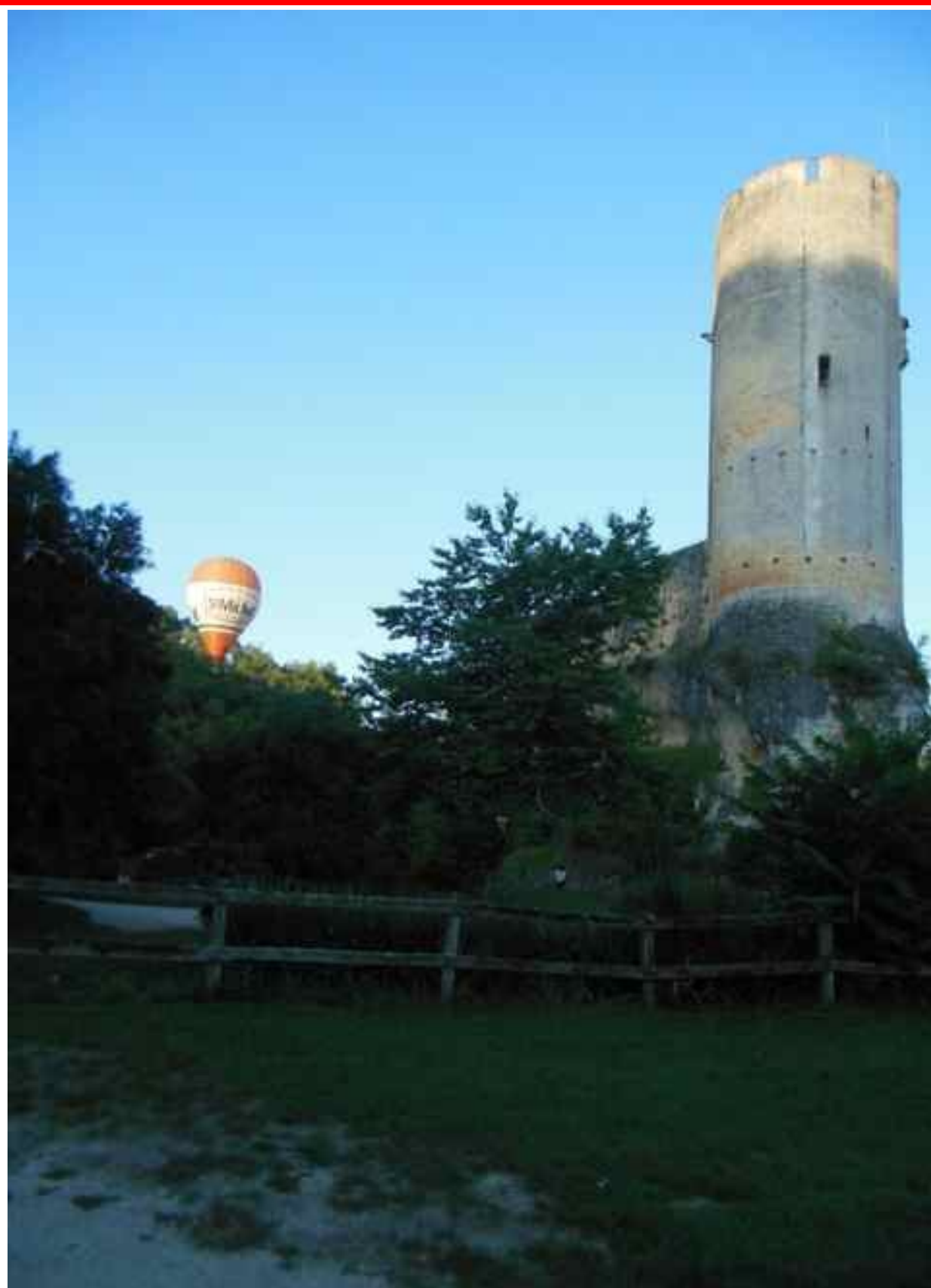
Gavaudun d'aujourd'hui Envol de montgolfière au pied du château le 23 août 2019