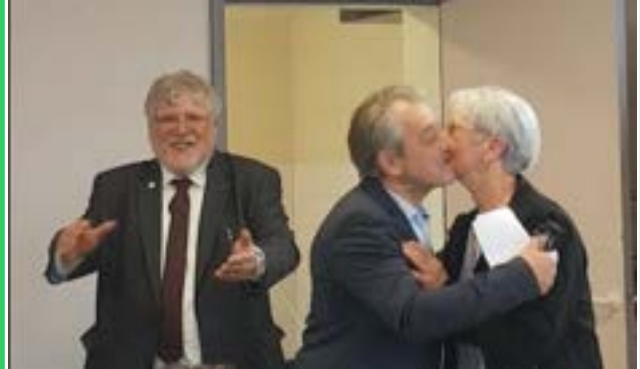
Restaurant Le Donjon