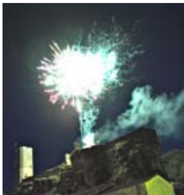
Une première à Gavaudun : un feu d'artifice le 14 juillet 2019