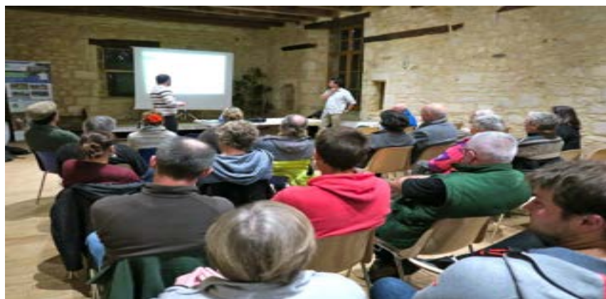
Nombreuse participation à la réunion du 27 novembre 2019

La vallée de Gavaudun, véritable joyau, qui lui a valu un classement est en train de se refermer. Les broussailles, ici et là, l'ont enlaidie. Pour lui redonner la beauté de son écrin d'antan, il faut préserver ses prairies dont une partie est abandonnée aujourd'hui. En collaboration avec le CEN (Conservatoire d'Espaces Naturels), un projet de réhabilitation est en cours. Une réunion publique d'information a eu lieu en novembre 2019. Des actions ont déjà commencé : rachat de terres, baux avec les propriétaires, bétail de retour sur les pâturages. Grâce aux subventions de la région, cette action va se poursuivre en 2020, avec en priorité le débroussaillage.