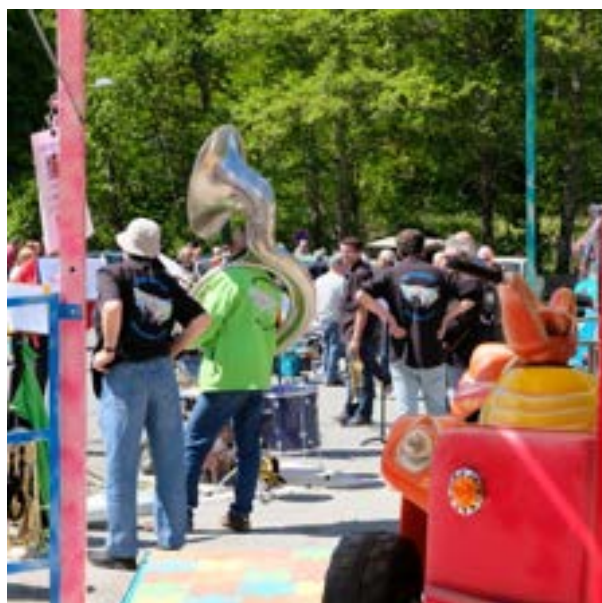
Fanfare Villeneuveoise, Les Décalés,