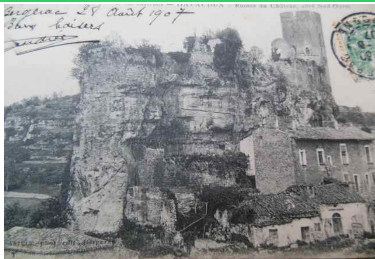
Gavaudun d'hier Carte postale début 1900