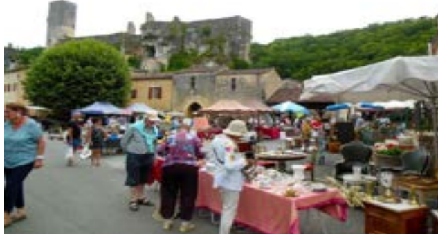
Foire à la brocante